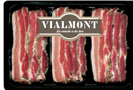
AIL ET PERSIL

Gencod : 3700468433750 Code : 170144 Poids : 400g VL : 6 DLC : 6 jours