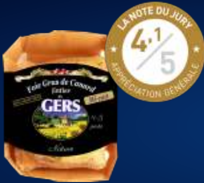
Lóbulo de foie gras de pato NATURAL SEMI-COCIDO