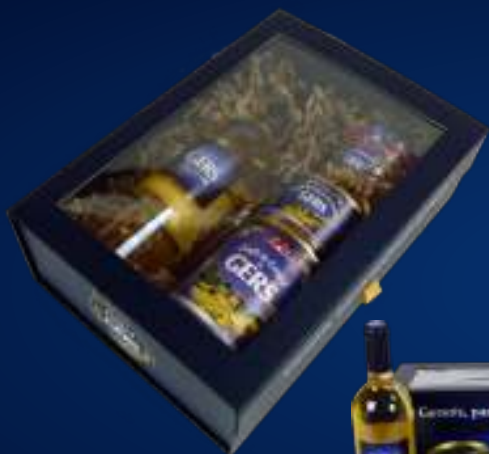
250179 Coffret MADE IN GERS