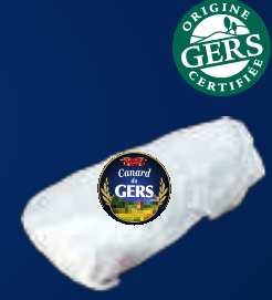
110425 Foie gras de pato Desvenado y trussado