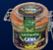
200081 Foie Gras de ganso entero