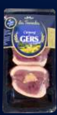
110337 Tournedos de Pechuga con Foie Gras x2