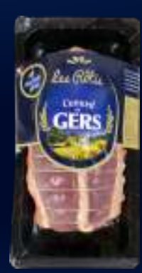
110335 Pechuga de pato asada con foie gras