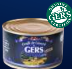
210031 Muslos de pato conditado 4 patas