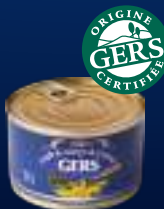
210033 Mollejas de pato