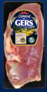
110419 Pechuga de pato x2