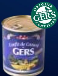
210030 Muslos de pato confitado 2 patas