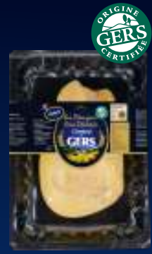
110412 Foie gras de pato Desvenado natural