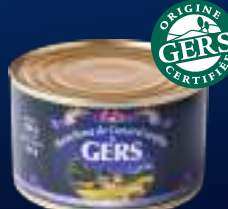
210032 Muslitos de pato confitado