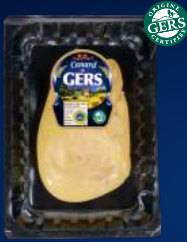
110181 Foie gras de pato Extra