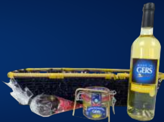
250162 Coffret DUO GERSOIS