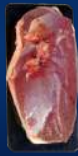
110191 Pechuga de pato x3