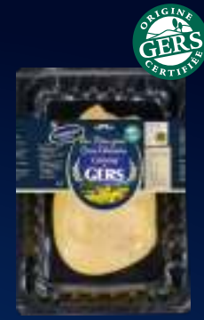
110510 Foie gras de pato Desvenado Sal y pimienta