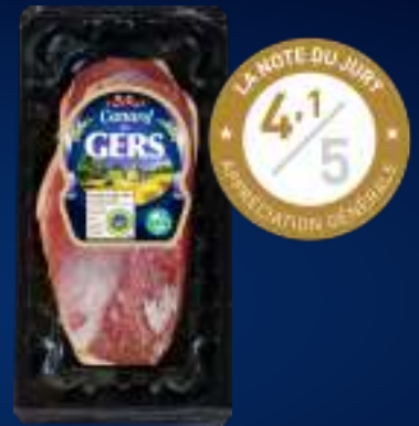
Pechuga de pato FRESCO