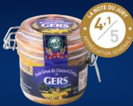
Foie Gras de pato entero SEMI-COCIDO - ENLATADO