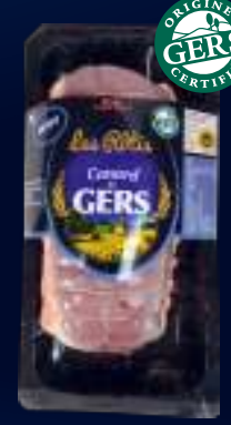
110334 Pechuga de pato asada Natural