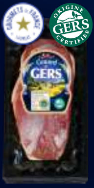
110152 Pechuga de pato Darfresh