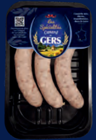
100201 Salchicha fina con pato confitado x3