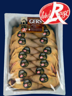
120413 Muslos de pollo de corral 5KG LABEL ROUGE