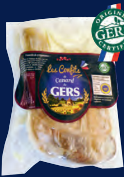
110177 Muslo confitado x1