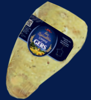
100258 Cou de canard farci