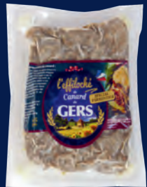
340006 Effiloché de pato "Parmentier especial"