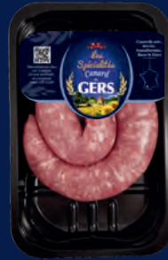
100058 Salchicha de pato al estilo de Toulouse