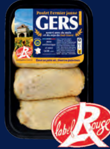
120544 Muslos de pollo amarillo x4 LABEL ROUGE