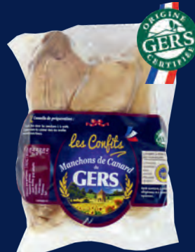
110578 Mangas confitadas x4