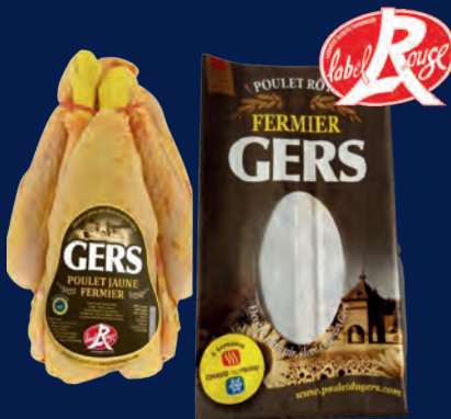
120555 PAC pollo de corral en bolsa LABEL ROUGE