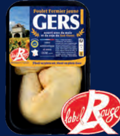
120545 Muslos de pollo amarillo x2 LABEL ROUGE