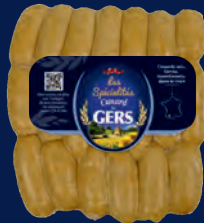
100256 C6ctel Duck Knacks x14