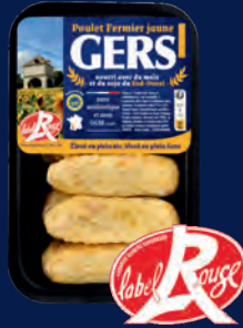
120543 Alitas de pollo amarillas x6 LABEL ROUGE