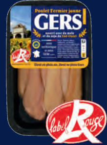
120539 Tiras de pollo amarillo LABEL ROUGE