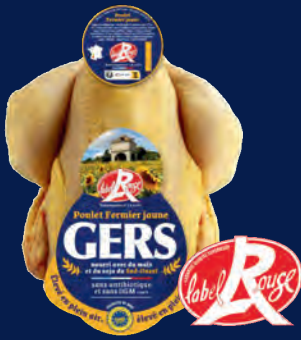
120550 Pollo de corral PAC amarillo LABEL ROUGE