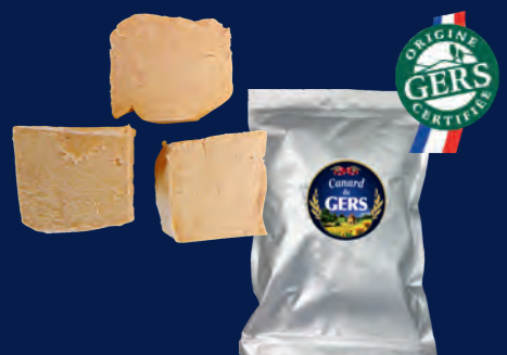
400116 Escalopes de Foie Gras