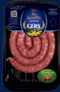
100200 Salchicha fina de pato con pimiento de Espelette