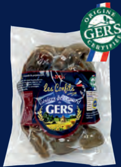
110179 Mollejas de pato confitadas enteras