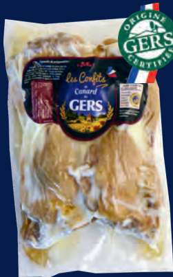
110176 Muslos confitados x4