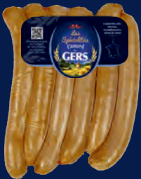
100257 Pato Knacks x6