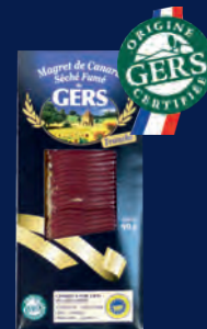
110588 Pechuga de pato seca ahumada en lonchas