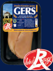
120548 Filetes de pollo amarillo x2 LABEL ROUGE