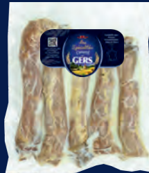
100259 Barras de cuello de pato