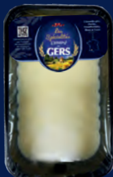
100731 Grasa de pato