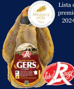
140043 Pintadas de corral PAC LABEL ROUGE