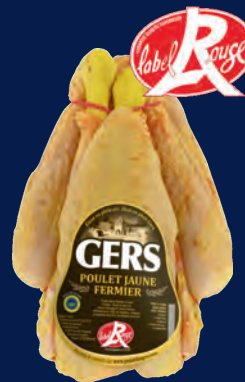
120460 Pollo de granja PAC amarillo LABEL ROUGE