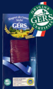
110587 Pechuga de pato seca en lonchas