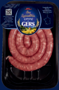
100009 Salchicha fina de pato